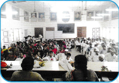
पेसा कायदा कार्यशाळा जुन्नर उपस्थित आदिवासी ग्रामपंचायत सदस्य