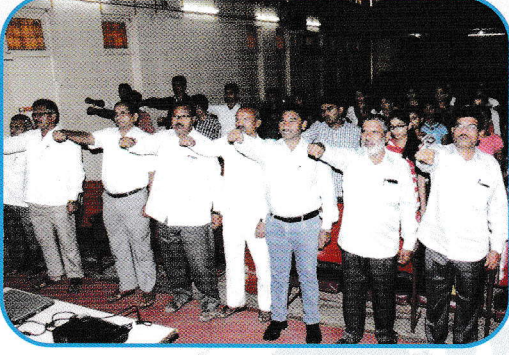
युवती प्रबोधन कार्यशाळेस उपस्थित युवती व संस्थेचे कार्यकर्ते शपथ घेताना