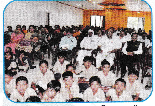
'उत्कृष्ट आश्रमशाळा पुरस्कार' वितरण समयी उपस्थित विद्यार्थी व पालक