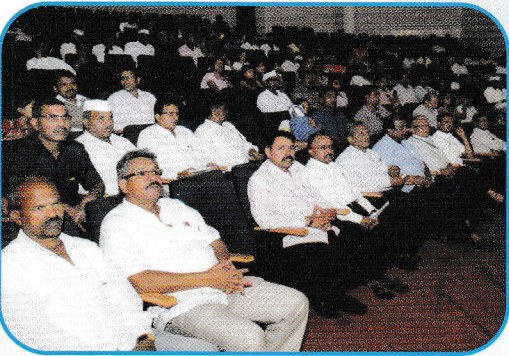
गुणवंत विद्यार्थी कार्यक्रम २०१५ उपस्थित विद्यार्थी व पालक