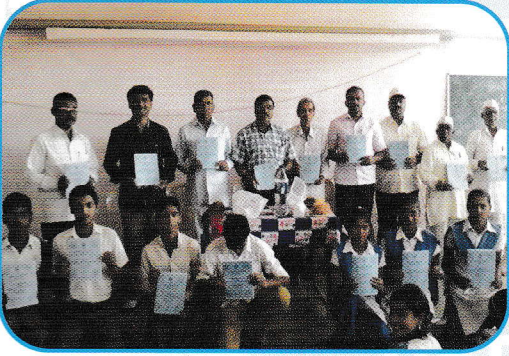
'परीक्षेला सामोरे जातानी' कार्यशाळेत प्रश्नपत्रिका संचाचे वितरण