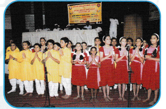
गुणवंत विद्यार्थी कार्यक्रमात स्वागत गीत गाणारे स्कूलचे बालक