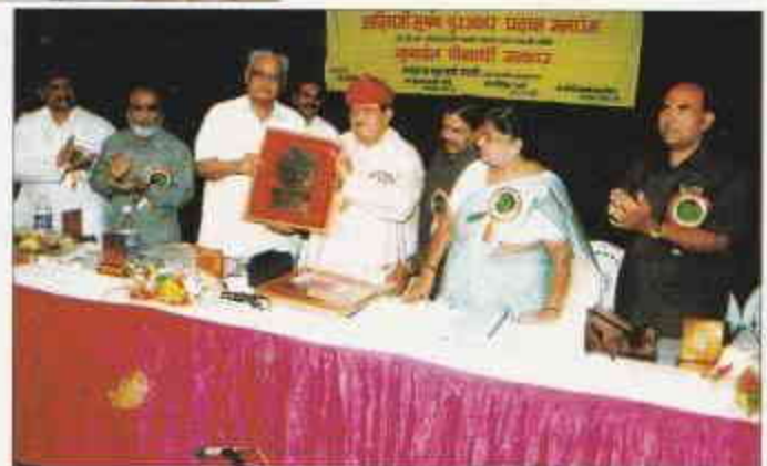
पा. श्री. मधुकरराव पिचड, माजी मंत्री-आदिवासीविकास